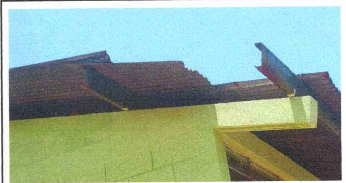
Foto 2: las estructuras de la escuela como las costaneras necesitan quitar el corrosivo y cambiar algunos de los mismo. Ya que se encuentra expuestos al sol y las lluvias ya el techo esta dañada por el viento.