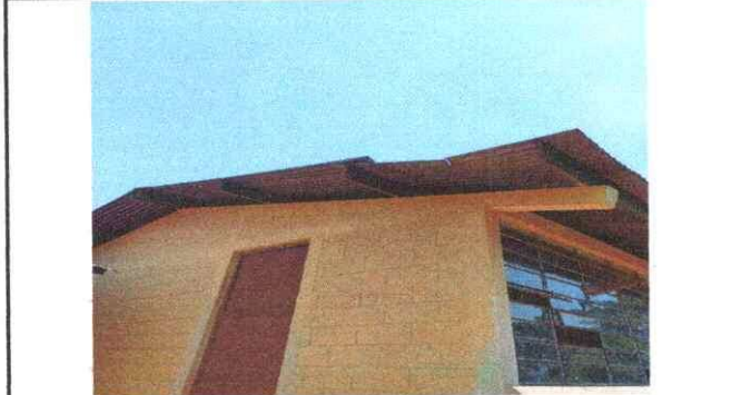
Foto 4: reparacion de ventanas de la direccion esta deteriorado por lo tanto necesita reparar y colocar balcones para mas seguridad.