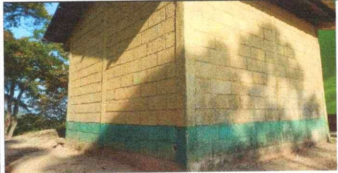
Foto 3: Aplicaion de Repello de la cocina como se ve en la fotografia necesita repello y pintura. Para mejorar la condiciones del area de preparacion de la alimentacion de los niños que asisten a recibir el pan del