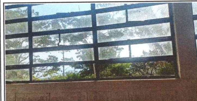
Foto 5: sustitucin de los pedazos de vidrios de las aulas de la escuela. A balcones que sera de muchos beneficios y seguridad para las aulas Y delos niño y niñas