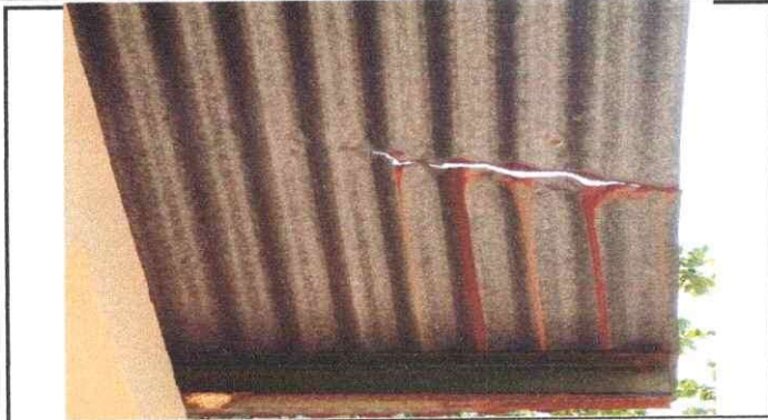
Foto1: Como se ve en la presente fotografia el entechado del centro educativo esta muy dañada por los fenomenos naturales y se filtrado las aguas en tiempo de invierno.